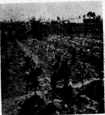
圖 二 第

歩合(%)は無水基礎で表はした。注意すべきは、沃度標準溶液中にKialahi浸漬から得る蒸發氣を集め、リヂウム・チオ硫酸標準溶液にて測定して炭素を測定した。何年前かに同實驗室は強酸浸漬を中止し、その代りに試料の融解が行はれてゐる。故に唯第六九號試料を除いては茲に報告する分析は炭酸鹽融解法(carbonate fusion method)によつて行はれた。鹽基置換(base exchange)定量はSchlienderger氏規定醋酸アモモニウム法によつて行つた。PHの測定は乾燥試料につき出来るかぎりquinhydrone電極を使用して行つた。これを修繕のため外國へ送つてゐた間は比色計法(colorimetric method)を代用しなければならなかつた。