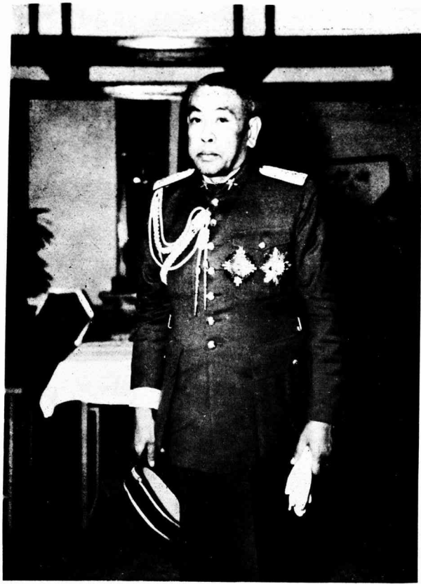
下閣將中ソホバ・ヤヒ節使派特國泰祝慶盟同泰日