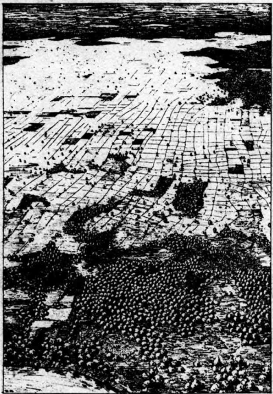
第一圖 (りあに尾末の文本は明説真寫)

タイでは氾濫の深い低平な平野を除けばこの大型の巢塚は一般にある。驚くほど均一に分布してをり、時にはさつと一英反に一つ一個の密度をなしてゐる(第二、三圖參照)。人間が故意に伐採しない限り、この巢塚は樹木や灌木の密林で被はれてゐるが、この種の樹木や灌木は周圍の米田や砂質森林地には、全然生えないことはないとしても少くともよく育たない種類のものである。