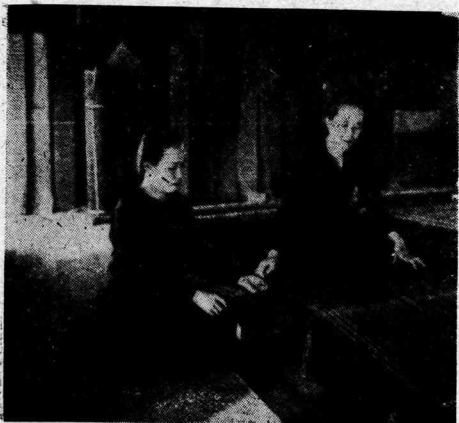
織機にそむくタイ婦人

織物業に於いても、それが最も發達してゐる地方に於いてもその製品は殆ど商業化されてゐない。従つてまたこのことよりして織物業の分布と重要性を正確に知り得ないが、アンドリュースに従つて、織物の生産より得る収入と織物に對する支出と